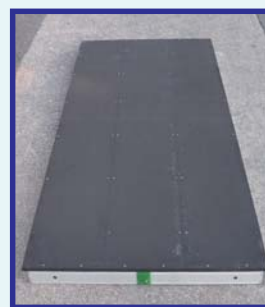
特殊面板アルミ平台

従来製面板を木製から特殊面板に改良。 経年劣化を防ぎ強固で安全なステージを提供します。 (積載荷重：350 kg / 枚)