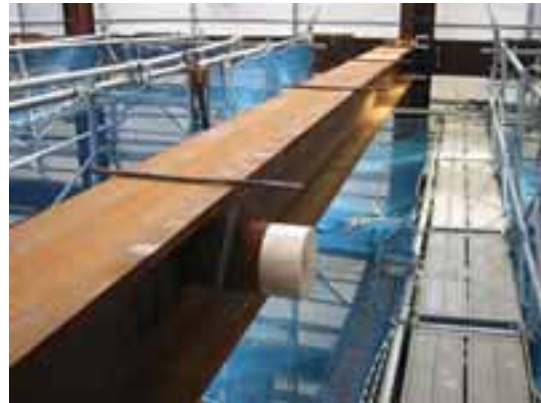
【設置写真(通路)】 現場: 関内(馬淵建設様) 2005年4月