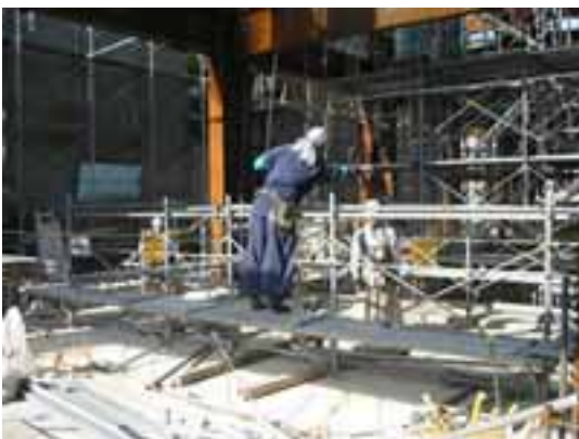
【地組み風景】 現場: 長者町(馬淵建設様) 2007年3月